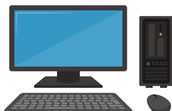
デスクトップパソコン