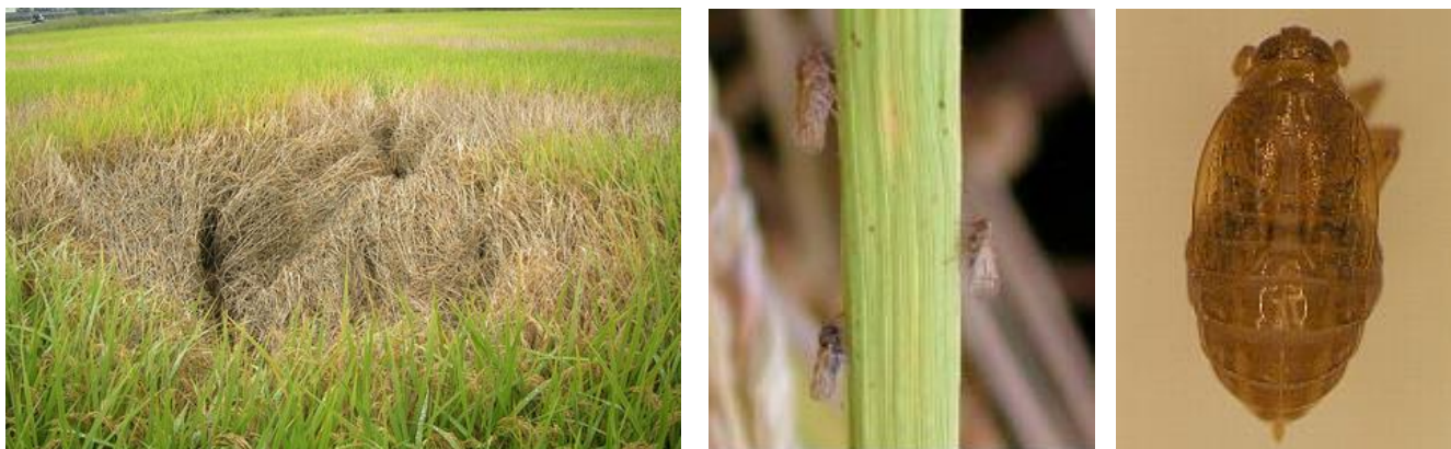
図1 坪枯れ（左）、トビイロウンカ長翅型成虫（中央）、短翅型雌成虫（右）