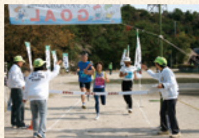
ラビットクロコン in 大久野島 (11月ごろ開催)

瀬戸内海国立公園大久野島の自然を満喫しながら、1kmから島内二周6kmのコースで競技が繰り広げられる。毎年400名近くが参加する一大イベント。