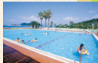
27 屋外プール ※夏期のみ