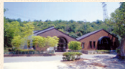
38 大久野島毒ガス資料館

夜、海を覗き込むと海底で青白く幻想的に光る「ウミホタル」。水温が温かい春から秋が一番の見ごろ。