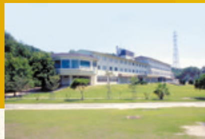
33 ビジターセンター