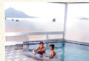
せと温泉 展望浴場