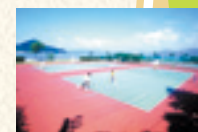
26 テニスコート 潮風を浴びながら爽やかにテニスが楽しめる。