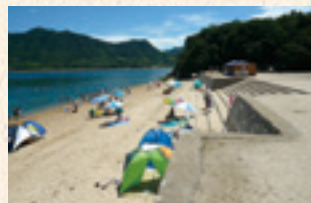
29 海水浴場 ※夏期のみ