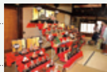
たけはら町並み雛めぐり