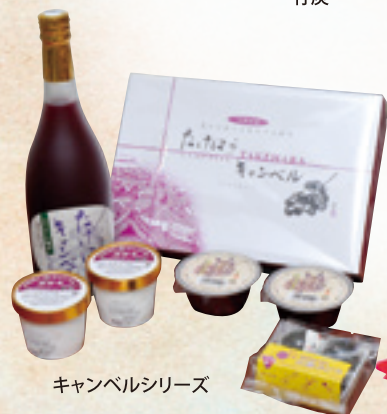
キャンベルシリーズ