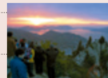
初日の出登山(黒滝山)