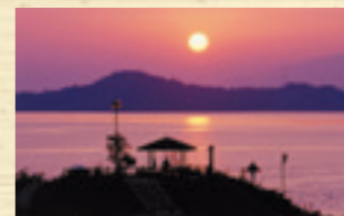
エデンの海の夕日