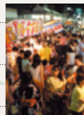
たけはら七夕まつり