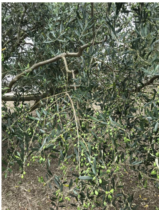
図1 枝の落葉の状態