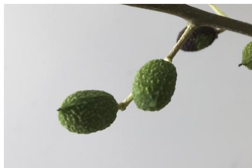
図2 果実の萎凋の状態