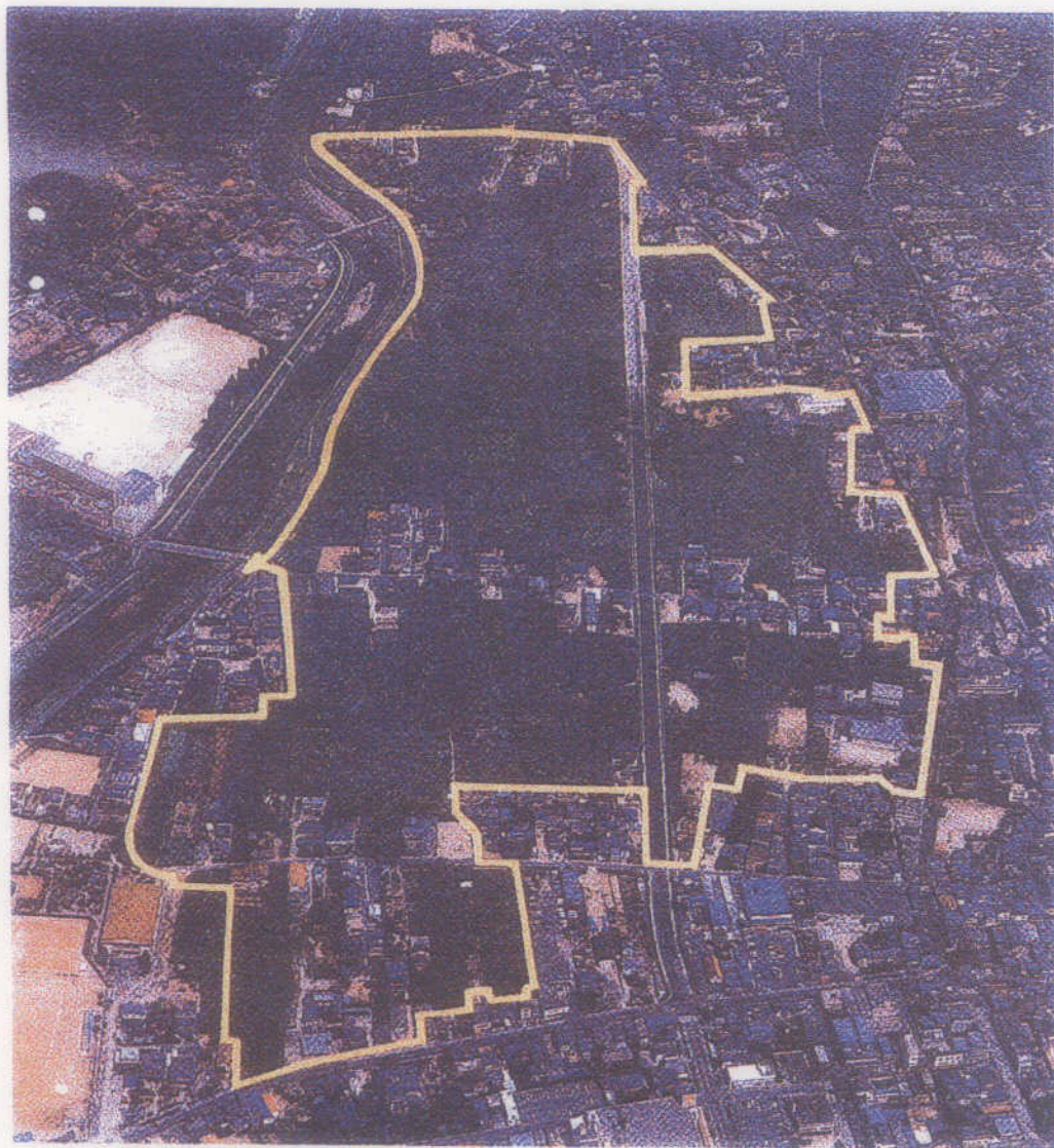
施行前(昭和62年撮影)