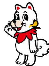
広島広域都市圏マスコットキャラクター ひろしま都市犬はっしー