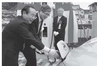
▲急速充電器贈呈式が行われました

この急速充電器は、日産自動車㈱から寄贈していただいたものです。「道の駅たけはら」で急速充電器の鍵を受け取り、開錠して充電します。利用料金は無料で、電気自動車をお持ちの人であれば、誰でもご利用できます。