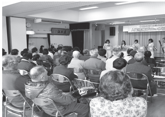
▲地域で開催した学習会の様子

日々の生活の中で、つい無関心になりがちな「人権」について、地域で開催する学習会に参加し、共に学びあいましょう。