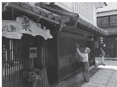
▲何気ない日常が絵になる町並み保存地区

町並み保存地区は、現在高齢化が進み、継承への分岐点にきています。次の世代に町並みの価値と継承の意義をいかに伝えるかが私たちの一番の宿題です。しかし、そこは気負い過ぎず、歴史の1ページをつないでいることを楽しみながら、50年後、100年後にも感動を与えられるような町並み保存地区を守り、伝えていきたいです。