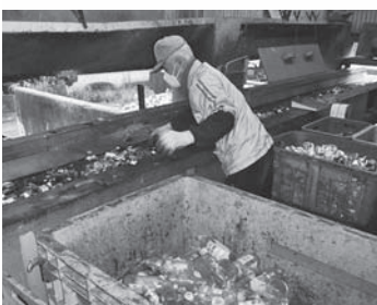
※仕分けは手作業で行っています。

分別が不十分なごみは、仕分け作業に余分な労力と費用がかかります。ごみを出す段階で正しく分別することが、リサイクルを推進するためにも大切です。ごみ処理による環境への負荷を軽減し、併せてごみ処理経費の大きな負担を軽減するために、市民一人ひとりがごみ排出量の削減とリサイクルの推進に取組みましょう。