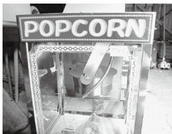
ポップコーン機・わたあめ機・ビニール提灯など