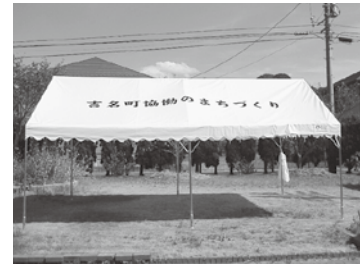
テント・発電機・サウンドシステムなど

※宝くじ助成事業は、宝くじの普及広報を目的として行われているもので、宝くじの収入を財源としています。