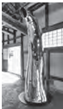
◀村岡 佑樹 「念」