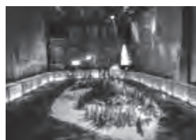
▲新井 健 「untitled」