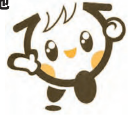
(広島県の子ども元気いっぱいキャラクターイクちゃん)