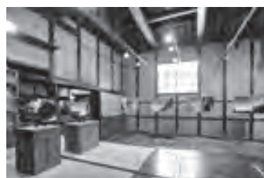
▲山本 暦 「The opposite side」