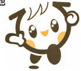
(広島県の子ども元気いっぱい)