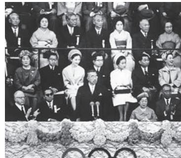
▲東京オリンピック開会式 (下から三段目左から3人目が勇人)