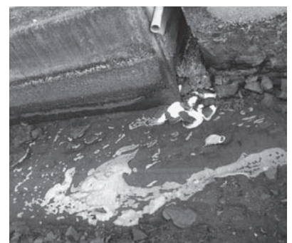
▲水路に流れる生活排水