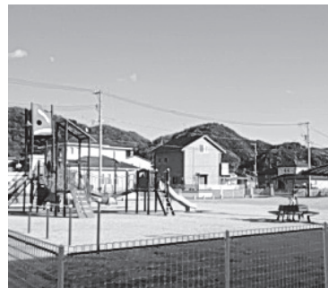
▲子どもたちのデザインを取り入れた「榎町公園」

行いながら、年齢や障がいのあるなどにかかわらず誰もが使いやすい施設となるよう検討しました。