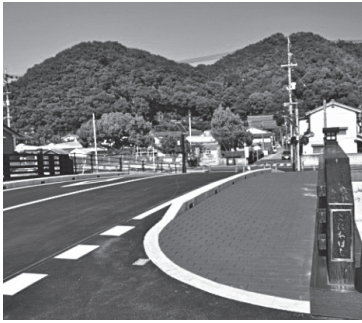
▲新開地区と町並み保存地区を結ぶ「古庭橋」

都市計画事業においても、地域と行政がさまざまな情報を共有しながら、安心して快適に暮らせるまちづくりを目指し、道路・公園・上下水道などの都市