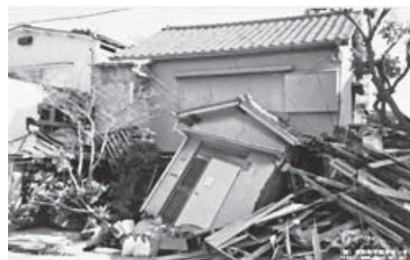
▲阪神・淡路大震災で倒壊した家屋