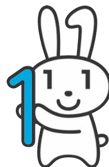
▲マイナンバーキャラクター「マイナちゃん」