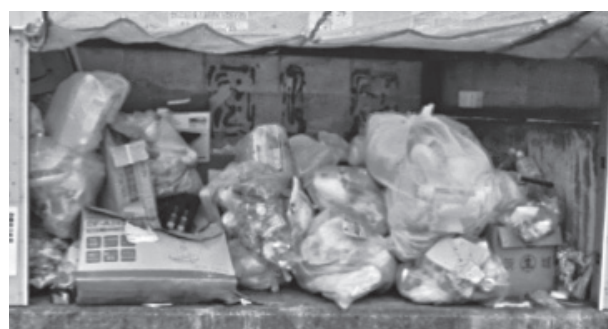
▲ルールが守られていないごみステーション

このようにルールが守られないごみ出しは、ごみステーションの乱雑化や、ごみ収集時の事故の原因となります。