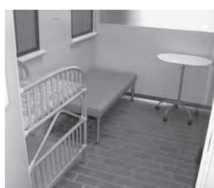
たけはら美術館 (中央五丁目) 1階事務室前に設置しています。