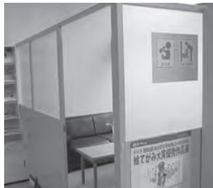
市民館 (中央五丁目) 1階に設置しています。