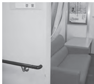
保健センター (中央三丁目) 休日診療所前に設置しています。