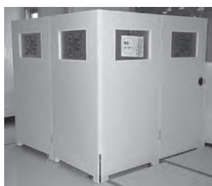
中央児童館 (中央四丁目) 2階エレベーター前に設置しています。