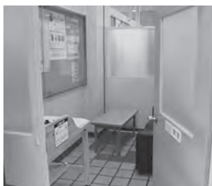
市役所 (中央五丁目) 1階ロビーに設置しています。