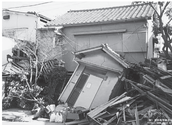
▲阪神・淡路大震災で倒壊した家屋