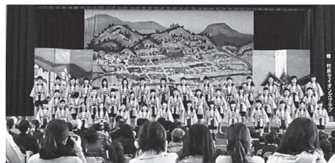
▲竹原小学校6年生による「竹原塩物語」