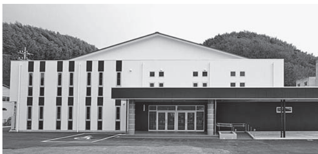
▲屋内運動場の外観