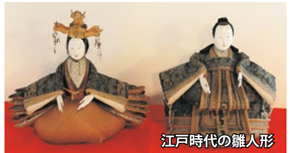
江戸時代の雛人形