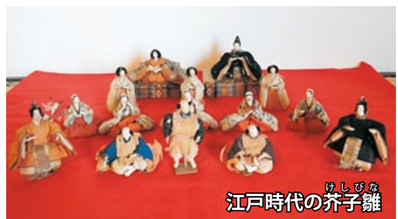
江戸時代のけしびな 芥子雛