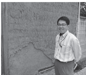
「お気に入りの藁壁。藁壁って珍しいんですよ。」

先人は、町並みや文化を築いてきました。中には糸が絡まったり、織物にならなかつたりすることもありません。私たち、次の世代の人々は、先人が紡いだきれいな糸、編んだ織物を継承しながら、他方、絡まった糸、上手く編めなかった織物をほどこき、新しい糸を上手く混ぜながら、これまでに以上に美しい織物を創ることが求められていると思います。