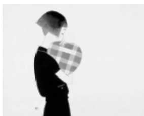
「ハートクッション」1990年代

漫画「赤色エレジー」を連載し、「小梅ちゃん」で親しまれ、現在も画家・イラストレーターとして活躍する林静一の世界を紹介し、