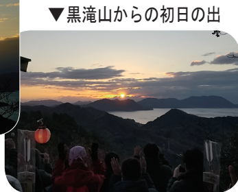
▼黒滝山からの初日の出

今年の元旦も、竹原市内の初日の出スポットに多くの人々が初日の出を拝みに集まりました。特に黒滝山では黒滝山を愛する会の主催により元旦登拝が行われ、山頂の黒滝山パノラマステージでは掛場獅子舞なども行われました。