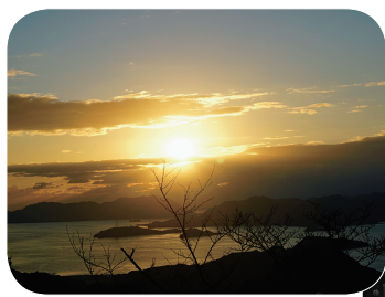
▲朝日山からの初日の出