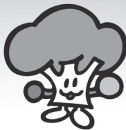
ひろしまの森づくりキャラクター モーリー

竹原市では、森林の持つ公益的機能（土砂の流出や崩壊を防止する機能など）を十分に発揮させることなどを目的に、市民の皆様から納めていただいている「ひろしまの森づくり県民税」（年額500円）を財源として、森林所有者が手入れ不足の人工林を整備するための支援や市内の里山林の整備を実施しています。その他にも、市内の子供達に森林・林業について学んだり親しんでもらうための市内小学校で体験学習等の実施や、森林整備を行う住民団体及びNPO団体等への支援など、竹原市の森林を守るための取組を行っています。