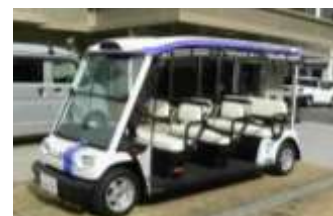
【グリーンスローモビリティ】

また、今年度は新たな取組として、竹原駅前あいふる通りを車両通行止めにするるとともに、新たな移動手段として期待されるグリーンスローモビリティを試行的に運行し、竹原駅前エリアと道の駅たけはらの回遊性を高めるための取組を実施します。