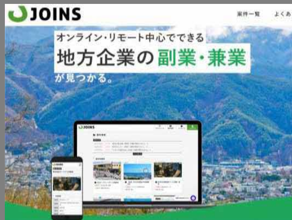
▲三原市の事業者展開中