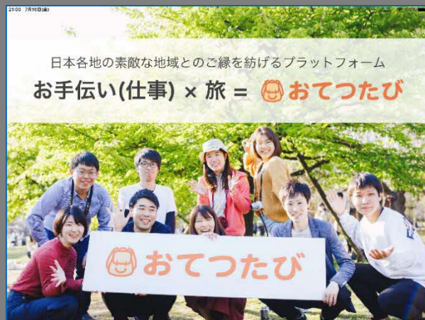
▲今年3月に竹原で実施、今後展開予定