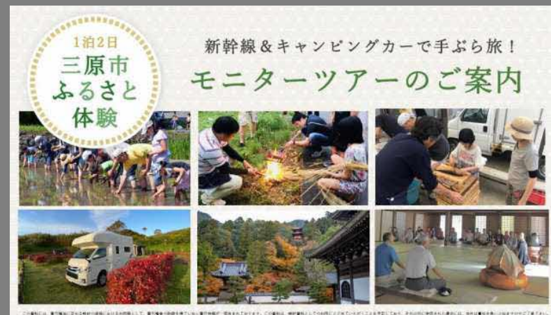
▲三原市高坂地区にて計画中