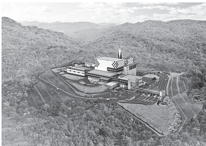
▲広島中央エコパーク完成図

新しいごみ処理施設では、令和3年10月1日から全ての種別のごみの受入を行います。