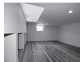
▲天窓付の明るいロフト