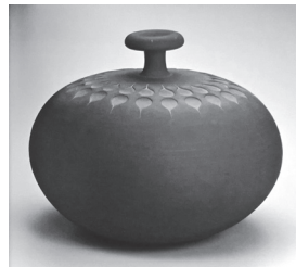
▲今井 政之 「苔泥彩 印華」

休館日 月曜日(※祝日の場合は開館) 祝日の翌日(2/12(水)、2/25(火))