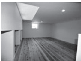
◀天窓付きの明るいロフト