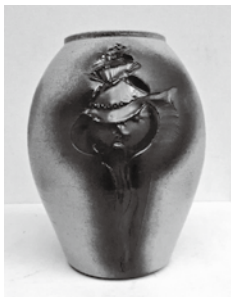
◀ 今井 政之 「釉彩 貝文 花壺」