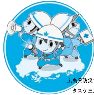
広島県防災キャラクター タスケ三兄弟

9月は、台風による被害が最も発生しやすいシーズンです。これまで以上に洪水や土砂災害、高潮による被害が心配されます。台風に関する情報は、事前にテレビやラジオなどから得ることができます。