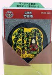
マンホールカードを入れたら完成です。