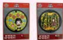
マンホールカード

マンホールカード配布時にお渡しします「お守り台紙」を想いを込めて折っていただき、マンホールカードをお守り袋の中に入れていただければ「マンホールカード・お守りバージョン」の完成です。