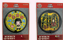
マンホールカード

マンホールカード配布時にお渡ししますお守り台紙を思いを込めて 折っていただき、マンホールカードをお守り袋の中に入れていただければ 「マンホールカード・お守りバージョン」の完成です。