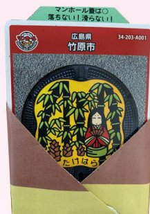
マンホールカードを 入れたら完成です。