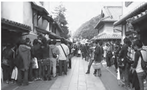
▲たまゆらファンで賑わう町並み

行われたイベントには、2日間で約5千人もの人が竹原を訪れてくれました。まさに活気が出たように感じます。市民のみなさんとともに、今後「たまゆら」をどのように展開していくかが重要ですね。