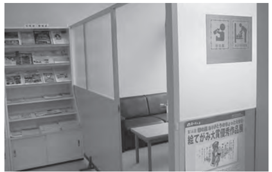
▲市内8箇所にて授乳室を設置(写真は市民館)

昨年は、東日本大震災があり、安全・安心が大事であるということを変更して痛感した年でもありました。安全で、