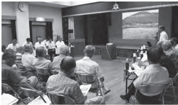
▲住民自治組織と協働で開催中のまちづくり懇談会

のみなさんと行政が、それぞれの地域の問題点や課題の解決に向けて、一緒に取り組んでいける良い機会だと捉えています。