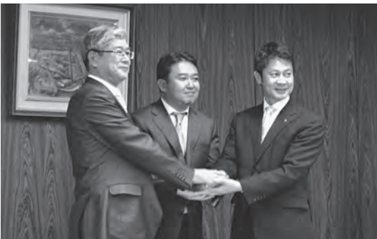
▲ 県と(株)ビットアイルとの立地協定調印式

そうですね。特に最近、竹 原市にとって重要な出来事と なったのが、竹原工業・流通 団地への企業立地。平成22年 7月に企業誘致専門官を採用