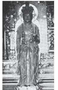
▲木造十一面観世音菩薩立像

もともとは福山市鞆町の小松寺にあったものですが、足利義昭が毛利氏を頼りに鞆へ移った際、戦乱を避けるために竹原に移されたと伝えられています。