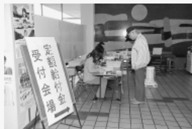
4月1日、定額給付金の受付が始まりました。

広島県内で、「市役所ですが、給付金を振り込むから手数料を先にお願ひします。」と、市職員などをかたつた、不審な電話がかかってくる事件が起っています。 市役所職員が「定額給付金」給付のために、金融機関や近所のスーパー、コンビニ等の現金自動受取機（ATM機）を使用して手続きをとめることはありません。 不審な電話があったら、関係機関またはよりの警察にご相談ください。 問い合わせ 広島県警察本部 ☎082-228-0110