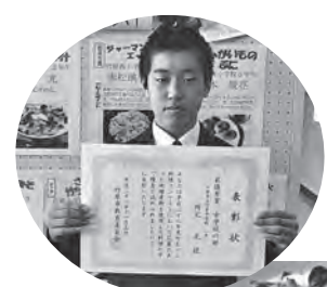
竹ちゃん料理コンテスト 【中学校の部】最優秀賞 「夏野菜のミルク冷や汁」