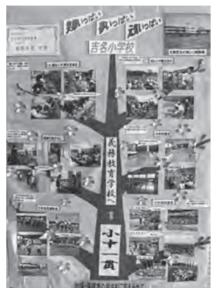
竹原市学校緑化推進事業 最優秀賞 【吉名小学校】

11月5日、市民館で、「原っ子の夢 輝く未来へ 広がる世界へ！」をテーマに、第14回竹原市子ども文化祭が開催されました。 開会に併せて、「竹原市学校緑化推進事業」と「竹ちゃん料理コンテスト」の表彰式が行われました。 表彰式の後には、竹原西幼稚園の園児と市内の小学校4校の児童が、合唱や太鼓を元気いっぱいに発表しました。 子どもたちの夢が、輝く未来へ向かって大きく羽ばたいていったのではないのでしょうか。