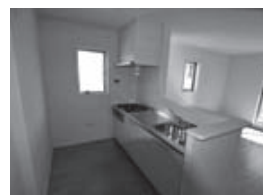
▲天窓付の明るいロフト ▲家族を見渡せる対面キッチン