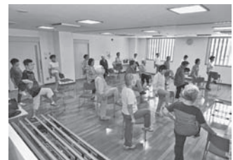
▲場所が変わっても、みんな元気です！