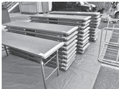
折りたたみテント・会議テーブル・運搬台車など