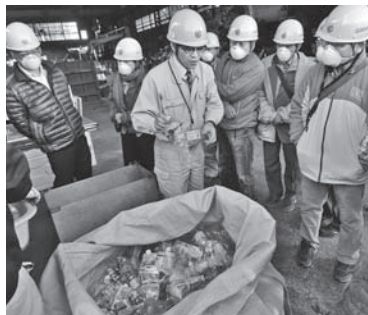
▲ひろしま地球環境フォーラムと連携したリサイクル施設の見学会の様子