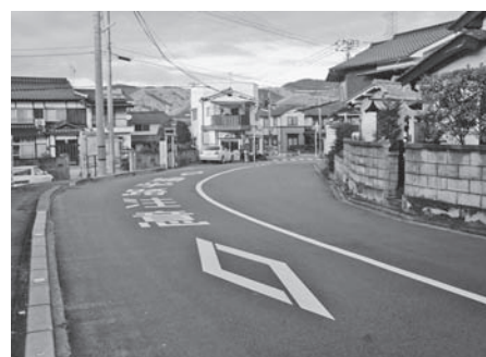
▲写真②市道中須明神線

市民のみなさんが安全で快適に利用できるよう、地域住民からの情報や日常のパトロールで確認した舗装の補修、路面排水を適切に行うための補修や清掃などを行っています。