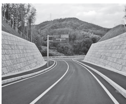
▲写真①市道八代谷曾井線