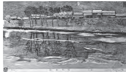
◀ 藤原 義治 「薄暮新雪」