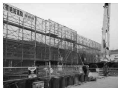
◀秋オープンに向け建設中

昨 年10月に名称を募 集したところ、5 54件の応募があり、審 査の結果、2件の応募が あった「道の駅たけはら」 を正式名称に採用するこ とにしました。 選考のポイントとしては、 ○親しみやすさがある （響きが良く、愛着が 持てる） ○わかりやすい名称であ る（あらゆる年代にわか りやすく、簡潔である） ○既存の施設や活動等に 使用されていない（紛 らわしい表示を避け る） ということなどを基準に