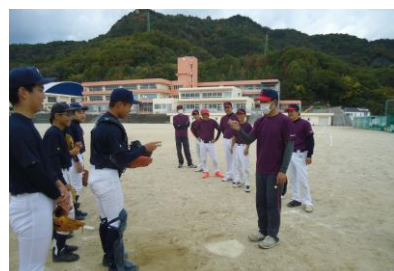
▲忠海町内総合スポーツ大会