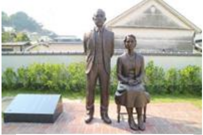
▲竹鶴政孝・リタ銅像