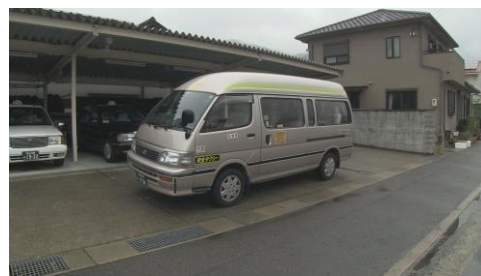
▲デマンド型乗合タクシー