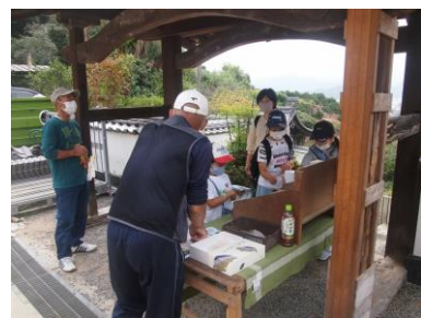
▲お寺めぐりスタンプラリー