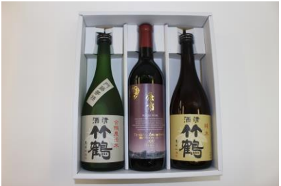
▲ふるさと納税返礼品コラボ