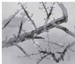
▲西山 翠嶂 「暁に薫る」